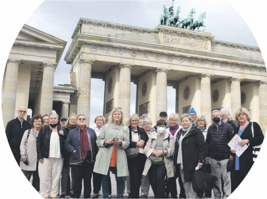
Matkalaiset Berliinissä Brandenburger Torilla 2021.